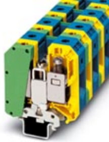
Schutzleiter-Reihenklemme, Schraubanschluss, Querschnitt: 16 mm 2 - 50 mm 2 , AWG: 6 - 1/0, Breite: 40 mm, Farbe: grün-gelb, Montageart: NS 35/15, NS 32

Bitte beachten Sie, dass die hier angegebenen Daten dem Online-Katalog entnommen sind. Die vollständigen Informationen und Daten entnehmen Sie bitte der Anwenderdokumentation. Es gelten die Allgemeinen Nutzungsbedingungen für Internet-Downloads. ( http://download.phoenixcontact.de )