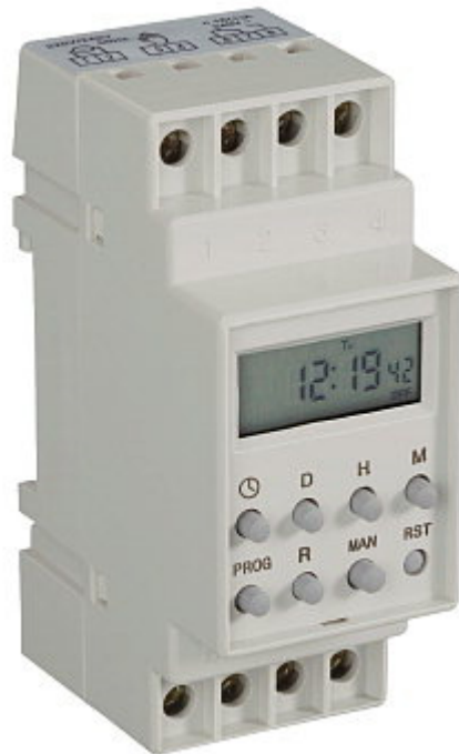
Digitalna tedenska stikalna ura Št. izdelka: 198520

Navodila za uporabo so sestavni del izdelka. Vsebujejo pomembne napotke za pripravo na zagon in uporabo. Če izdelek predate tretji osebi, poskrbite za to, da ji izročite tudi ta navodila za uporabo.