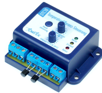
Afb.. Module in optionele behuizing 19 12 92

Passende gedrukte en gestante folies worden meegeleverd.