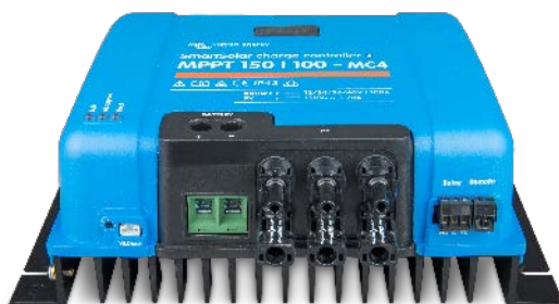
Solar-Laderegler MPPT 150/100-MC4 ohne Display