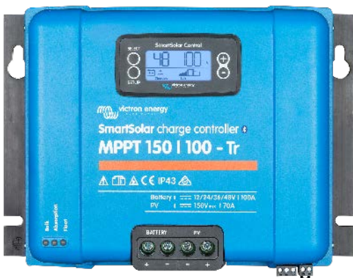
Solar-Laderegler MPPT 150/100-Tr mit einsteckbarem Display